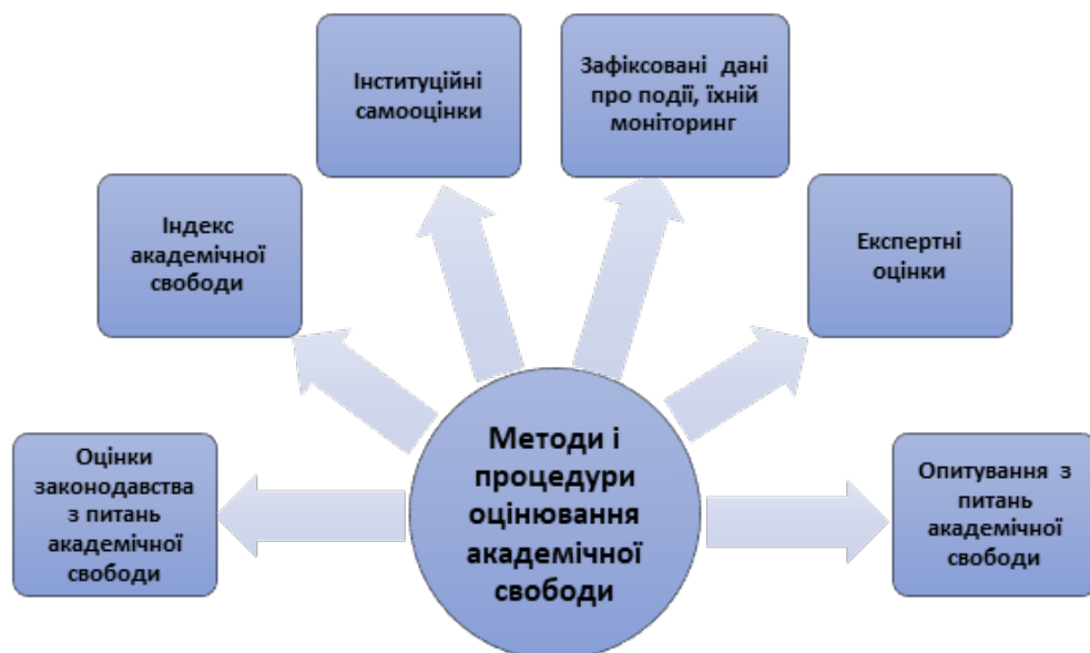
Рис. 1. Система методів і процедур оцінювання академічної свободи

Розробка авторського інструментарію вимагала детального аналізу світового досвіду структуривання подібних досліджень. У цьому контексті показовими є напрацювання європейських колег, сфокусовані на уніфікації критеріїв академічної свободи. Так, Г. Ковач (G. Kovats) та З. Ронай (Z. Ronay) на прохання Групи з питань майбутнього науки і технологій (STOA) разом з Підрозділом наукового прогнозування Генерального директорату парламентських дослідницьких послуг Секретаріату Європейського парламенту узагальнили методи і процедури моніторингу стану академічної свободи у світі [5]. Серед існуючих методів і процедур оцінювання академічної свободи вони виокремили такі: оцінки законодавства з питань академічної свободи; Індекс академічної свободи (AFI); інституційні самооцінки (система показників інституційної автономії, University Autonomy Scorecard); зафіксовані дані про події (моніторинг академічної свободи від мережі Scholars at Risk (SAR)); експертні оцінки (зокрема оцінка в межах доповіді Freedom House “Свобода у світі”); опитування представників ака-